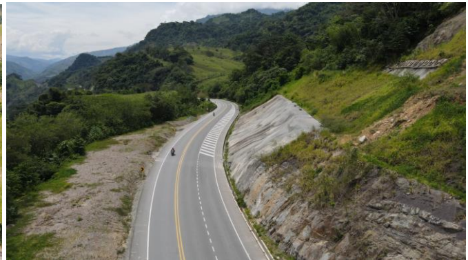
Tercer carril de adelantamiento